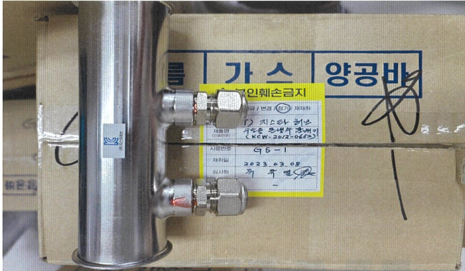
<시험 전 시험품 사진>