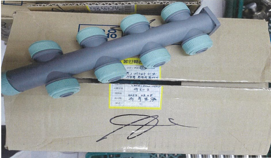
<시험 전 시험품 사진>