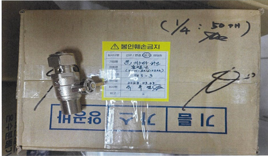
<시험 전 시험품 사진>