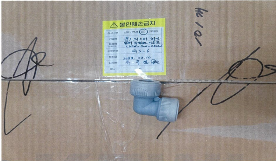
<시험 전 시험품 사진>