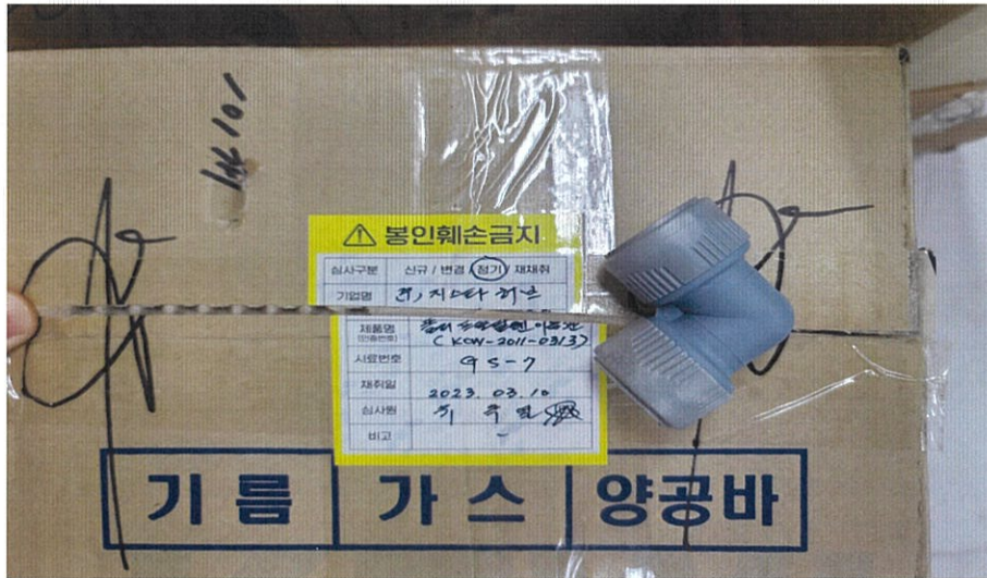
<시험 전 시험품 사진>