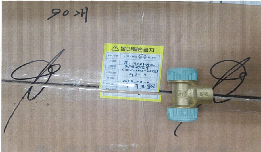
<시험 전 시험품 사진>